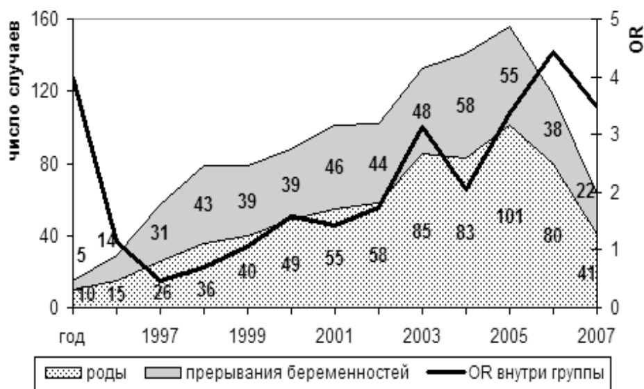
Рис. 1. Динамика исходов беременностей у ВИЧ-позитивных в Гомельской области за 1996-2008 гг.

Наиболее эффективными методами управления частотой перинатального инфицирования ребенка являются антиретровирусная профилактика (АРП) и родоразрешение путем операции кесарева сечения (КС). До 2006 г. в Республике АРП регламентировалась приказом № 147 [10], наиболее часто использовался азидотимидин (AZT) по короткой (с 36 нед. беременности) либо по длинной (с 14 нед.) схеме,